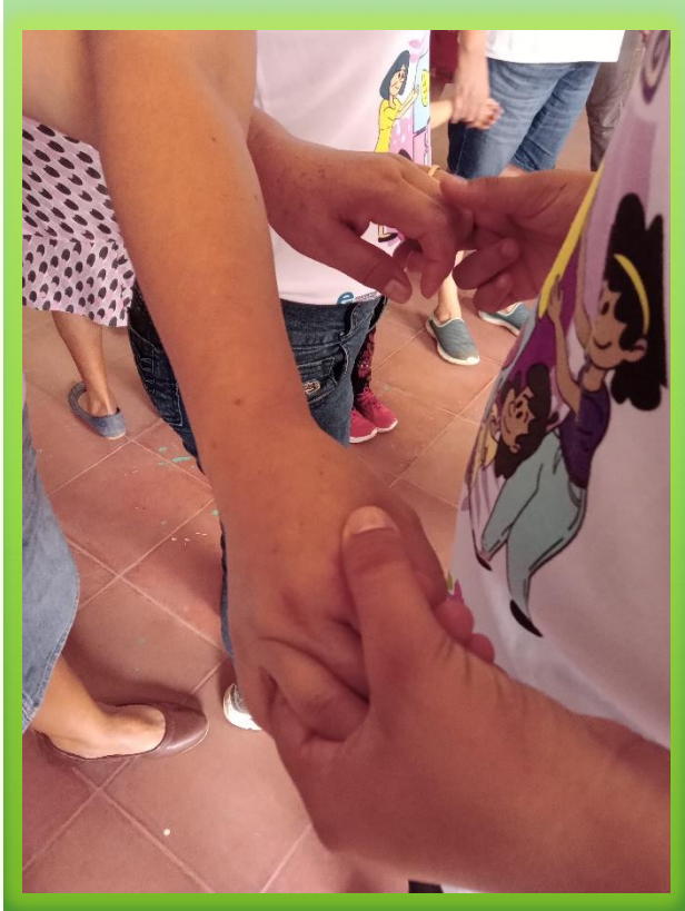
Jornada formativa como parte de la Escuela Ecofeminista, que se desarrolla en Ciudad Arce.

Ciudad Arce enfrenta serios problemas ambientales debido a la actividad industrial y la explotación de recursos naturales. Estos problemas impactan negativamente en la vida de las mujeres, que a menudo son las más afectadas por las condiciones ambientales adversas debido a sus roles tradicionales de cuidado de su familia y quehaceres domésticos.