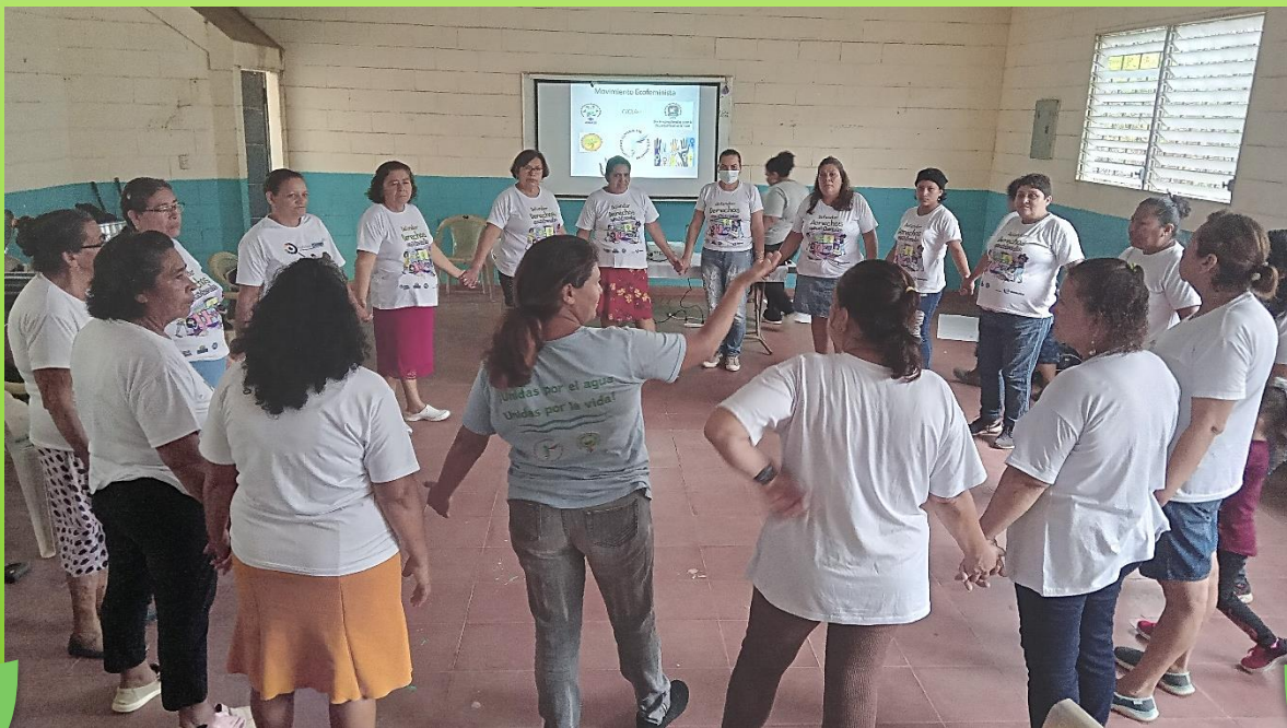
Mujeres del distrito de Ciudad Arce, ubicado en el municipio de La Libertad Centro, participan en la Escuela Ecofeminista, en el marco del proyecto “Construyendo un nuevo modelo de ciudad, cuidadora, sostenible y equitativa”

El viernes 24 de mayo de 2024, se desarrolló la cuarta jornada de la Escuela Ecofeminista, que se realiza en el marco del proyecto “Construyendo un nuevo modelo de ciudad, cuidadora, sostenible y equitativa”, ejecutado por ORMUSA, con el apoyo del Ayuntamiento de Barcelona, Sant Boi de Llobregat y Cooperacció.