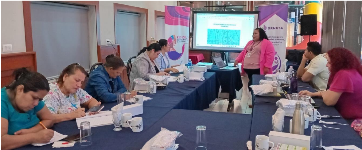
Presentación de la propuesta "Refugios Climáticos de Cuidados en Ciudad Arce"

La Organización de Mujeres Salvadoreñas por la Paz (ORMUSA), presentó en febrero 2025, la propuesta "Refugios Climáticos de Cuidados en Ciudad Arce", elaborada por la organización social Colectivo punto 6. En la actividad participaron referentes de la Alcaldía Municipal de La Libertad Centro, mujeres de la Red de Defensoras, integrantes de ASOMMCALL y la representante de CooperAccació en El Salvador.